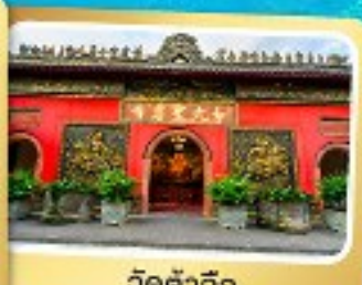
วัดต้าอ้อ