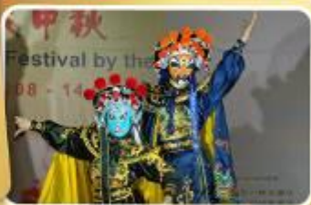
โชว์เปลี่ยนหน้ากาก