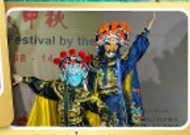
โชว์เปลี่ยนหน้ากาก