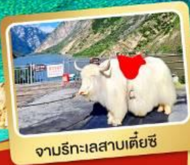
จามรีทะเลสาบเตี้ยซี