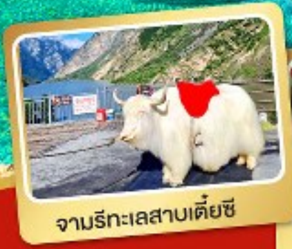
จามรีทะเลสาบเตี้ยซี