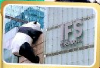
หมีแพนด้ายักษ์ปีนคอกถนนซุนซี