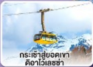
กระเช้าสู่ยอดเขาดืออาไวเลซซา