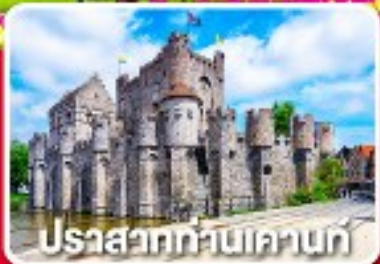
ปราสาทขามเอนท์