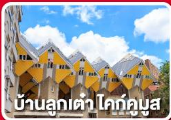
บ้านลูกเต๋า โคกคูบุง

เยือนเมืองแปลกดินแดน 2 ประเทศ บาร์ล-นัสซา บาร์ล-เฮร์ตโท