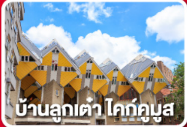
บ้านลูกเต๋า โคทักกูซ