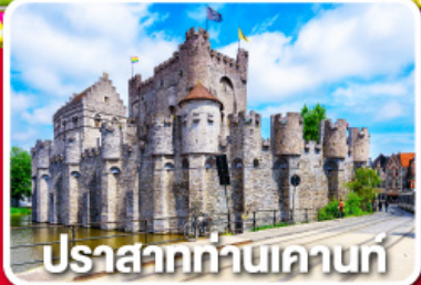
ปราสาทท่านเคานท์