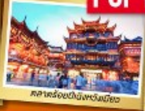
ศาลาร้อยปีเมืองหนิงเฉียว