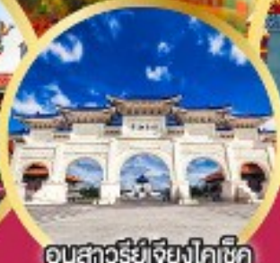
อนุสาวรีย์เจียงไคเช็ค