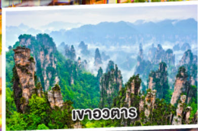
เขาอวตาร