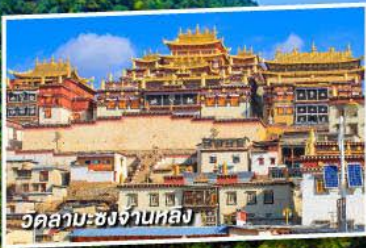
วัดลามะ-ซงจางหลง

บินภายใน 1 เที่ยวบิน 5 วัน ไม่ลงร้านช้อปปิ้ง 4 คืน