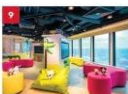
Little Dreamers Club Feed your children's imaginations with games, workshops, costume parties and even a DJ booth at our kids-only club.