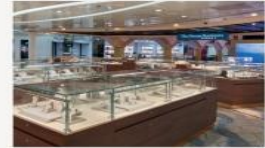
The Boutiques International duty-free shopping