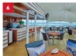
Seafood Grill Enjoy your favourite outdoor hot pot dining with a wide selection of meats, seafood or vegetarian options, paired with an extensive beverage list.