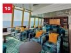
Palm Court Relax in our sophisticated observatory lounge as you enjoy sweeping ocean views.