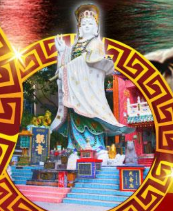
เจ้าแม่กวนอิม หาดริฟส์เบย์