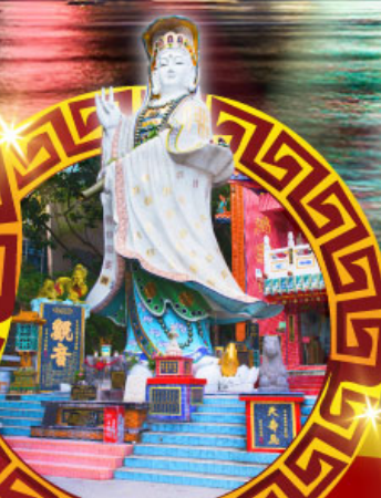
เจ้าแม่กวนอิม ทาดรีฟส์สีย์