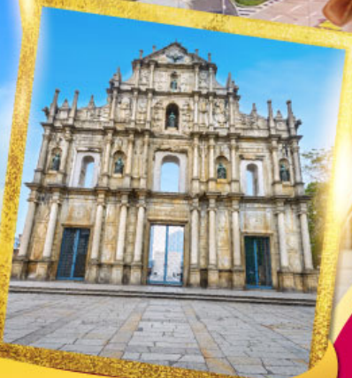
วิหารเซนต์ปอลเซนต์ปอล