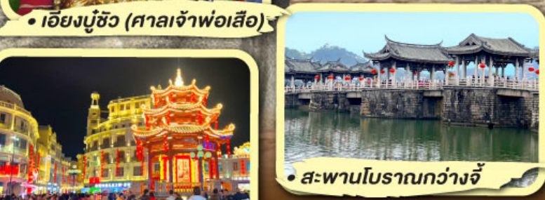
• สะพานโบราณกว่างจี้