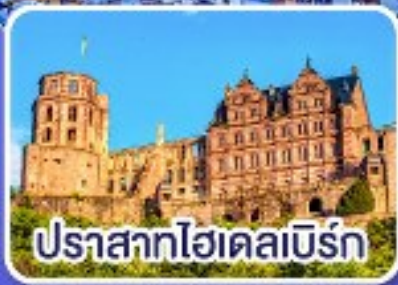
ปราสาทไฮเดิลเบิร์ก