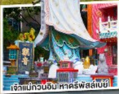
เจ้าแม่กวนอิม หาดริพัลล์เบย์