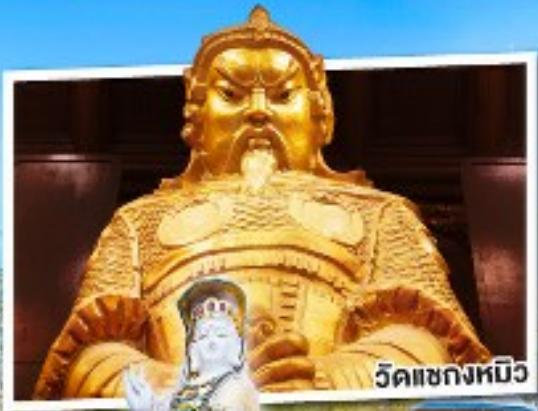
วัดเขangkงหมิว