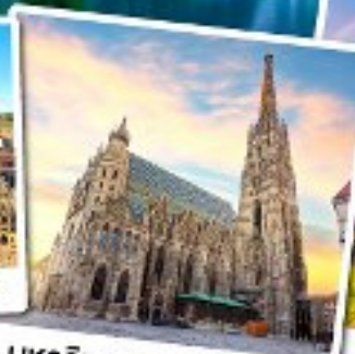
มหาวิหารเซนต์สตีเฟ่น