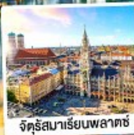
จัตุรัสมาเรียนพลาตซ์

28 เม.ย.-04 พ.ค. 67 01-07, 06-12, 08-14, 20-26 พ.ค. 67 29 พ.ค.-04 มิ.ย. / 05-11, 18-24 มิ.ย. 67 24-30 ก.ค. 67