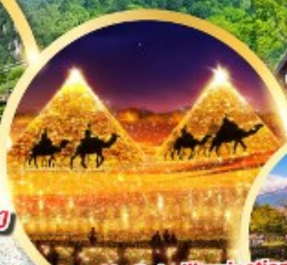
Nabana No Sato Illumination