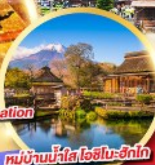
หมู่บ้านน้ำใส โอชิโนะฮัทไก