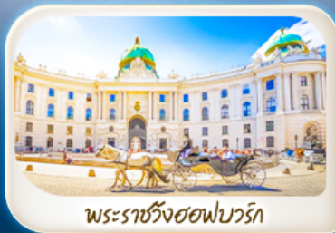
พระราชวังฮอฟบวร์ก

12-18 มี.ค.68 / 19-25 มี.ค.68 28 เม.ย. - 4 พ.ค.68 7-13 พ.ค.68