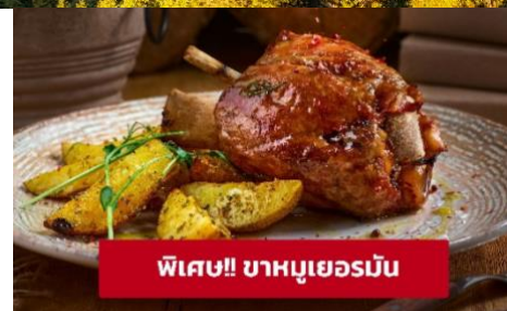
พิเศษ!! ขาหมูเยอรมัน

ที่พัก : DORMERO Hotel Zürich Airport หรือโรงแรมและเมืองระดับใกล้เคียงกัน (ชื่อโรงแรมที่ท่านพัก ทางบริษัทจะทำการแจ้งพร้อมใบนัดหมาย 5-7 วัน ก่อนวันเดินทาง)