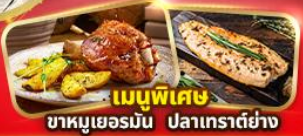
เมนูพิเศษ ขาหมูเยอรมัน ปลาเทราต์ย่าง

แถมฟรี! น้ำดื่ม 1 ขวดทุกวัน, ปลั๊กไฟยูนิเวอร์แซล