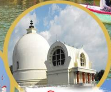
กุสินารา