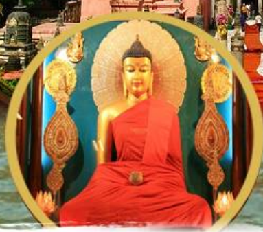
พระพุทธรเมตตา

กุสินารา สารวัตต์ ฆาธาณสี สารนาท ราชคฤห์