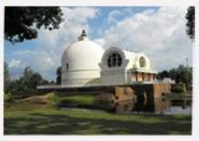
กุสินารา