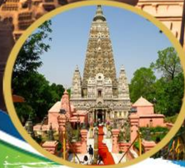
พุทธศคยา

ราชคฤห์ นาลันทา สารนาถ ล่องเรือแม่น้ำคงคา