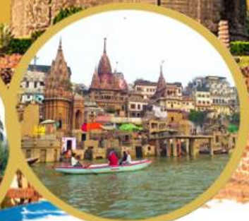
ล่องเรือแม่น้ำคงคา