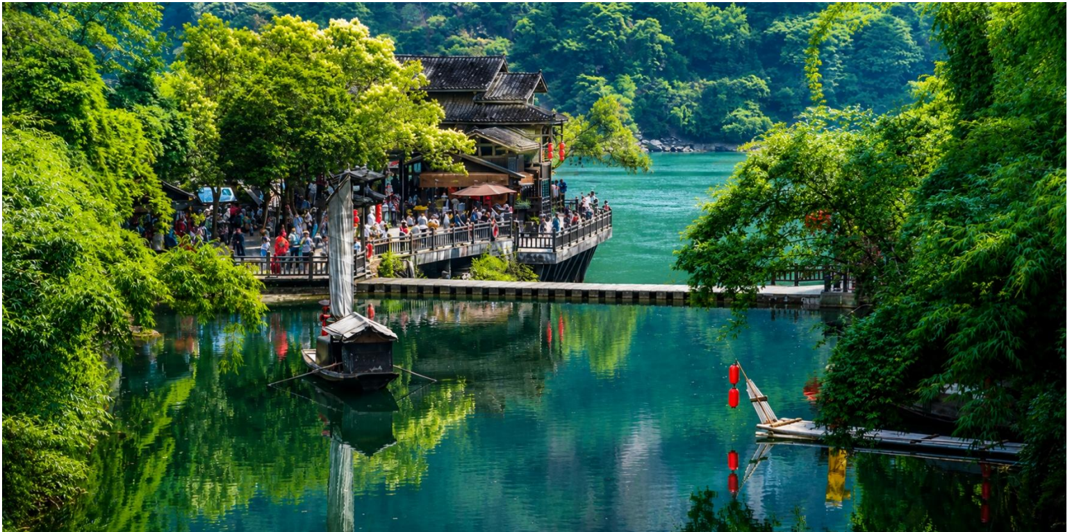
เที่ยง บริการอาหารเที่ยง ณ ภัตตาคาร (มื้อที่2)

นำท่านสู่ หมู่บ้านซานเซียเหรินเจีย (Sanxia Renjia) (รวมล่องเรือ) สถานที่นี้เป็นที่รู้จักกันในชื่อ หมู่บ้านสามผา แหล่งท่องเที่ยวระดับ 5A ตั้งอยู่ในเขตหุบเขาสามผา ริมแม่น้ำแยงซีเกียง โดดเด่นด้วยทัศนียภาพทางธรรมชาติอันงดงามของ ภูเขาหินผา สายน้ำ และหุบเขาที่โอบล้อมกันอย่างกลมกลืน สถานที่แห่งนี้สะท้อนวิถีชีวิตดั้งเดิมของชาวลุ่มแม่น้ำแยงซีเกียง ผ่านสถาปัตยกรรมพื้นบ้าน วัฒนธรรม ประเพณี ที่ยังคงเอกลักษณ์ไว้อย่างครบถ้วน พร้อมให้ท่านได้ชมการแสดง เรื่องราวเกี่ยวกับวิถีชีวิตควบคู่กับสายน้ำ