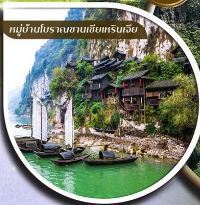
หมู่บ้านโบราณชานเซี่ยเหรินเจีย