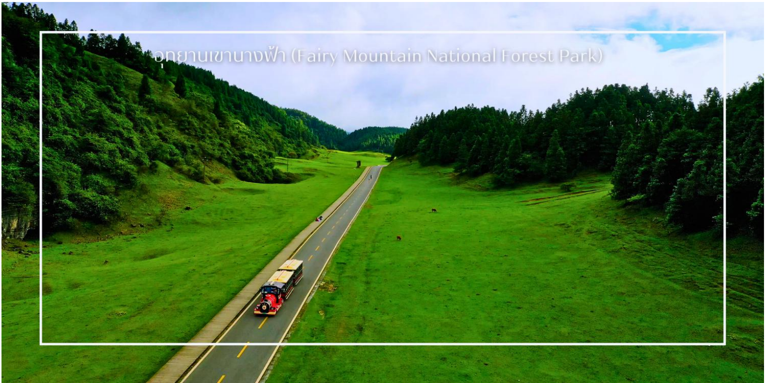
อุทยานเขานางฟ้า (Fairy Mountain National Forest Park)

กิโลเมตร มีระดับความสูงเฉลี่ยกว่า 2,000 เมตรจากระดับน้ำทะเล ท่านสามารถเพลิดเพลินกับการเดินเล่นชมธรรมชาติ ชมวิวทัศนอันงดงามของภูเขา พร้อมบริการรถไฟขบวนเล็ก ที่จะพาท่านชมวิวท่ามกลางธรรมชาติได้อย่างสะดวกสบาย