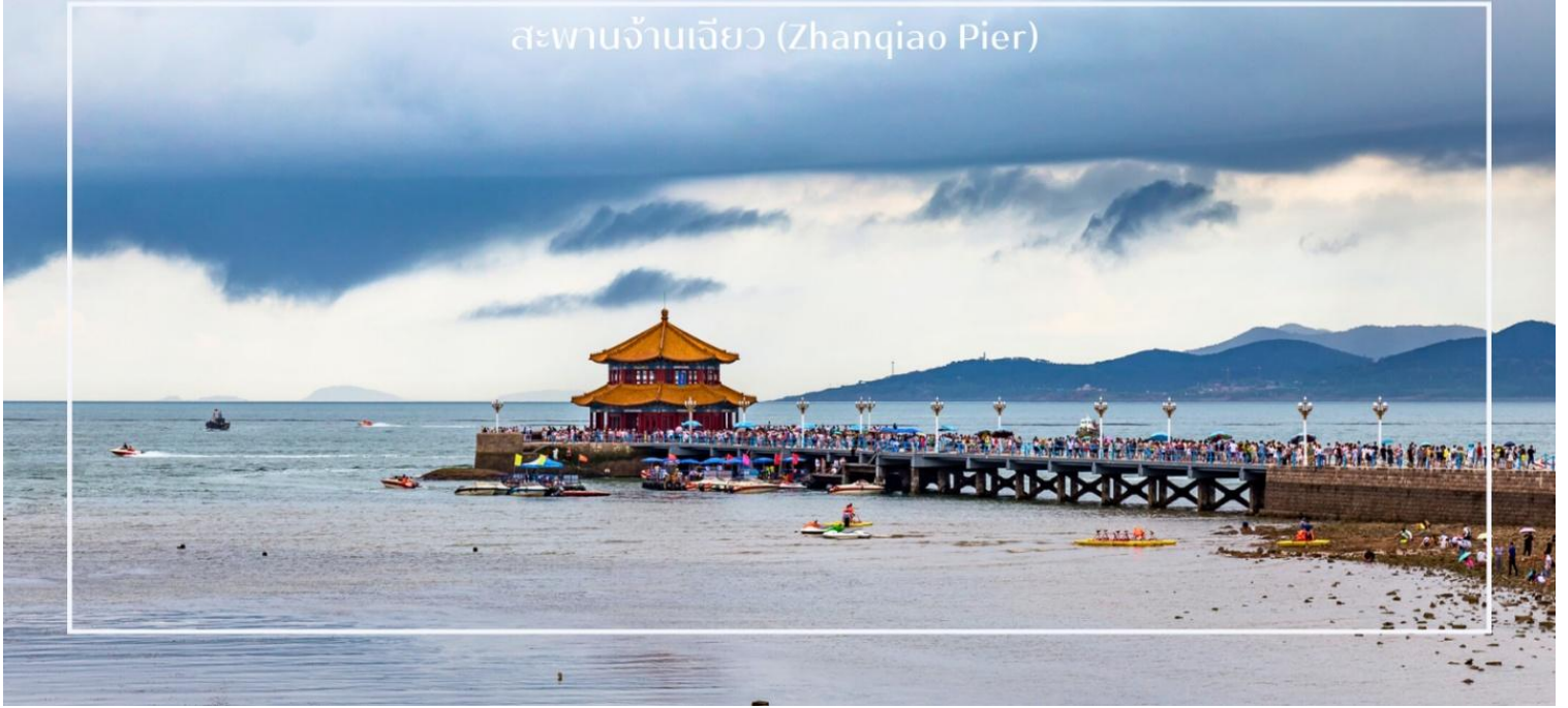
สะพานจ้านเจียว (Zhanqiao Pier)

นำท่านเดินชมบรรยากาศบน ถนนจงซาน (Zhongshan Road) ถนนสายเก่าแก่ใจกลางเมืองชิงเต่า ที่เต็มไปด้วยเสน่ห์ของอาคารสไตล์ยุโรปยุคอาณานิคมและกลิ่นอายเมืองท่าริมทะเลอันคึกคัก ถนนสายนี้ถือเป็นย่านการค้าสำคัญในอดีต ปัจจุบันเต็มไปด้วยร้านค้า ร้านอาหาร คาเฟ่ และร้านของฝากท้องถิ่นให้เลือกซื้ออย่างเพลิดเพลิน