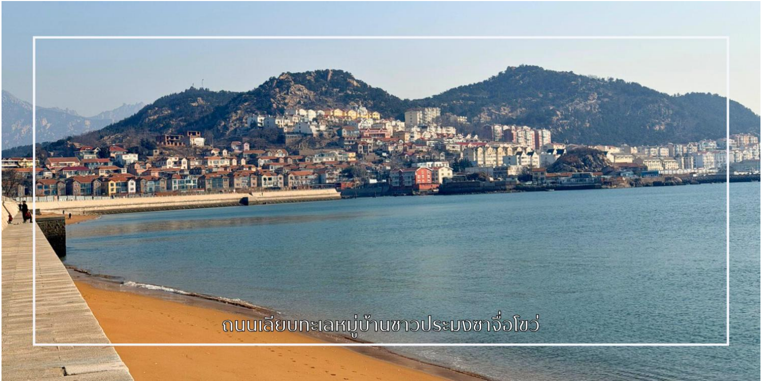
ถนนเลียบบทะเลหมู่บ้านชาวประมงซาโจว