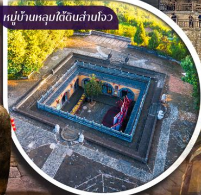
หมู่บ้านหลุมใต้ดินसानโจว