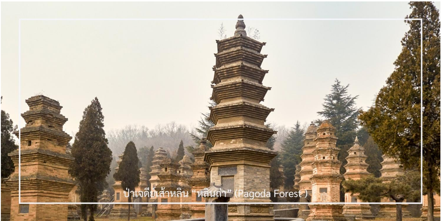
ป่าเจดีย์สี่เหลี่ยม “หลินถ่า” (Pagoda Forest)

ภายในบริเวณเต็มไปด้วยเจดีย์หินจำนวนมากกว่า 240 องค์ ซึ่งบางองค์มีความสูงถึง 15 เมตร เจดีย์แต่ละองค์มีขนาดและรูปร่างแตกต่างกันไปตามยุคสมัย เช่น ทรงกลม ทรงสี่เหลี่ยม และทรงหกเหลี่ยม อีกทั้งยังประดับด้วยลวดลายแกะสลักอย่างวิจิตรงดงาม บางองค์มีจารึกที่บอกเล่าชีวประวัติของพระภิกษุผู้ได้รับการบูชาขึ้น ๆ