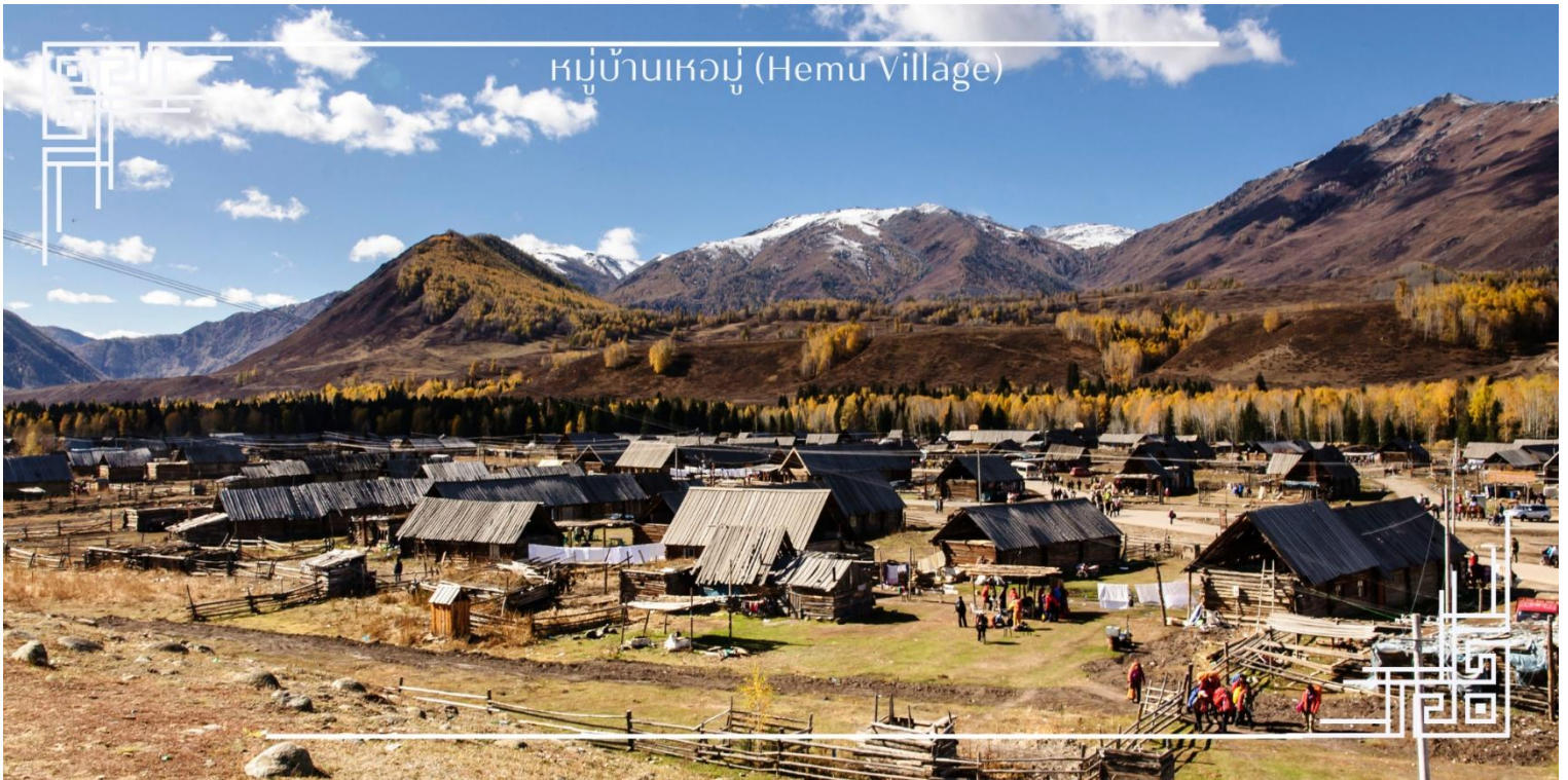
หมู่บ้านเหมู (Hemu Village)

กันยายน - ตุลาคม (High Season) ช่วงเวลาที่สวยงามที่สุดของปี เมื่อป่าสนเบิร์ชเปลี่ยนสีเป็นเหลืองทองอร่ามทั่ว หุบเขา ตัดกับท้องฟ้าสีครามใส เกิดเป็นทิวทัศน์ฤดูใบไม้ร่วงที่งดงามราวภาพวาด