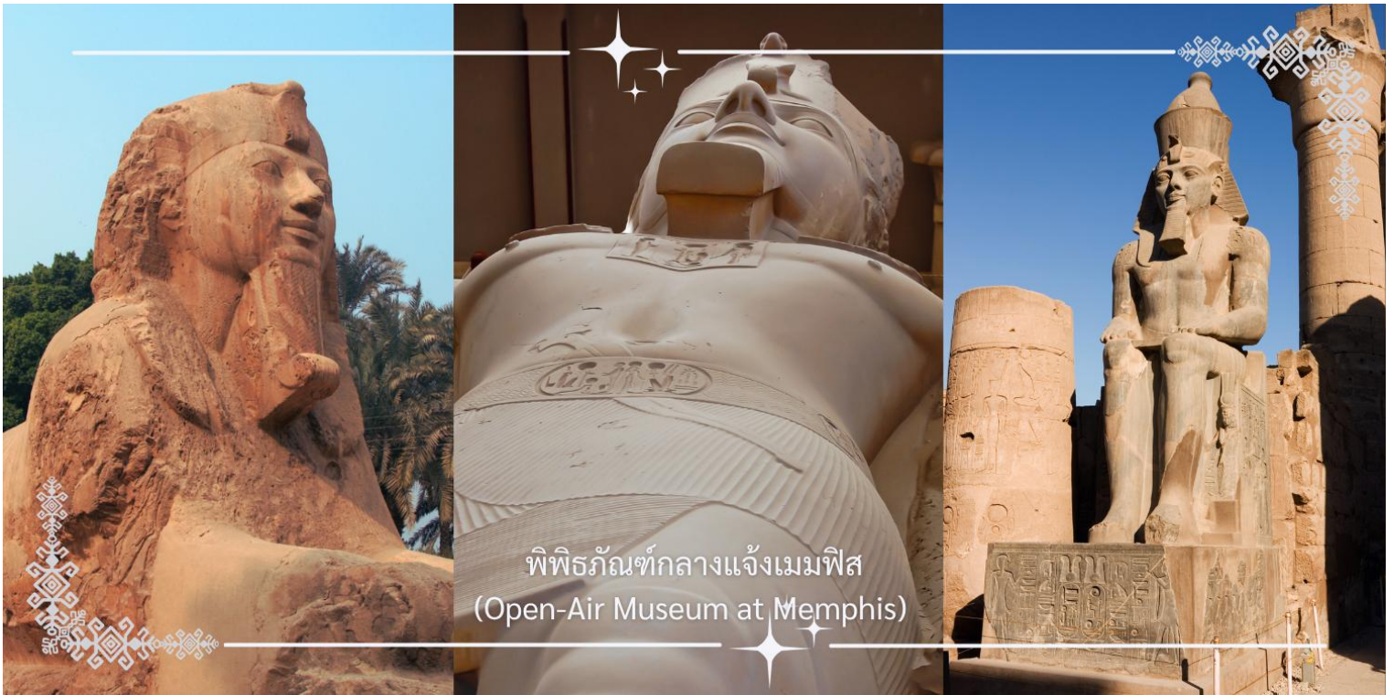
พิพิธภัณฑ์กลางแจ้งเมมฟิส (Open-Air Museum at Memphis)

นำท่านเดินทางสู่ ซัคคารา (Saqqara) หนึ่งในสุสานหลวงที่สำคัญที่สุดของอียิปต์โบราณ ตั้งอยู่ทางใต้ของกรุงไคโร เป็นส่วนหนึ่งของเนโครโพลิสแห่งเมมฟิส ที่นี่ถือเป็นต้นแบบของการสร้างพีระมิดในยุคแรกเริ่ม และยังเป็นที่ตั้งของ พีระมิดขั้นบันได (Step Pyramid) อันเลื่องชื่อของฟาโรห์โจเซอร์ (Djoser)