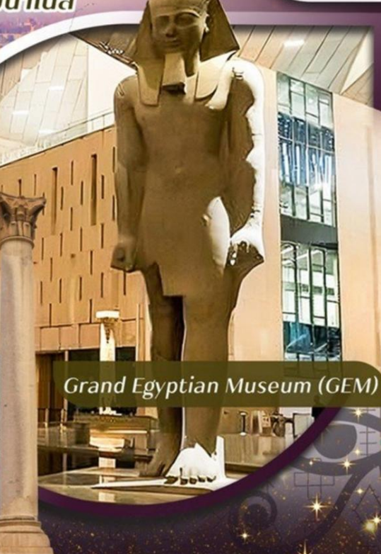
Grand Egyptian Museum (GEM)

คอนเฟิร์มออกเดินทาง ตั้งแต่ 15 ท่าน ขึ้นไป