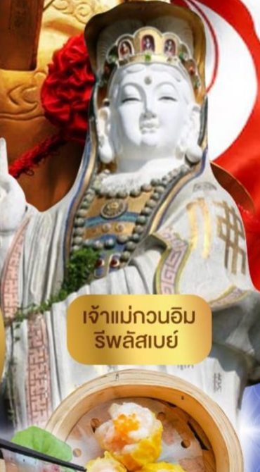
เจ้าแม่กวนอิม ริฟลิสเบย์