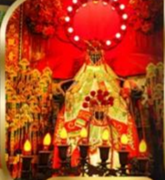
เจ้าแม่กวนอิม ฮ่องกง