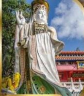
เจ้าแม่กวนอิม ริฟลิสเบย์