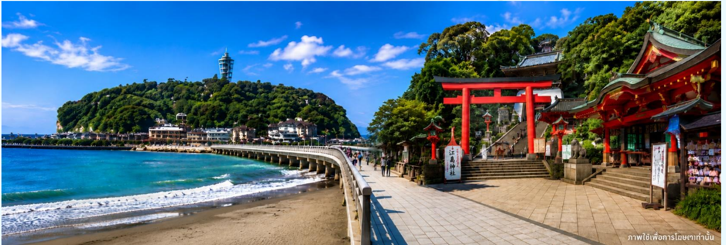
ภาพใช้เพื่อการโฆษณาเท่านั้น

สมควรแก่เวลา นำคณะเดินทางสู่ โตเกียว อิสระช้อปปิ้งที่ ย่านชินจูกุ (Shinjuku) แหล่งบันเทิงและ แหล่งช้อปปิ้งขนาดใหญ่ใจกลางเมืองหลวงโตเกียว เป็นศูนย์รวมแฟชั่นเก๋ ๆ เท่ห์ ๆ ของเหล่าบรรดา แฟชั่นนิสต์ มีสถานีรถไฟชินจูกุที่เป็นเหมือนศูนย์กลางของย่านนี้ ซึ่งเป็นหนึ่งในสถานีที่คึกคักที่สุดใน ญี่ปุ่น ในแต่ละวันมีผู้คนจำนวนมากถึง 2.5 ล้านคน ที่ใช้บริการสถานีแห่งนี้ ทางด้านตะวันตกย่านนี้ที่ เต็มไปด้วยตึกสูงระฟ้าหลายอาคาร มีทั้งโรงแรมชั้นนำ และในสวนทางด้านตะวันออกนั้น คือ คาบูกิโจ (Kabuki-jo) เป็นย่านที่เต็มไปด้วยห้างสรรพสินค้า, ร้านเครื่องใช้ไฟฟ้าขนาดใหญ่อย่าง Bic Camera และย่านบันเทิงยามราตรีที่มีร้านอาหารเยอะแยะมากมาย เช่น ร้านอิซากายะ (Izakaya)