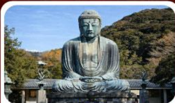
หลวงพ่อดาไคบุตซึ