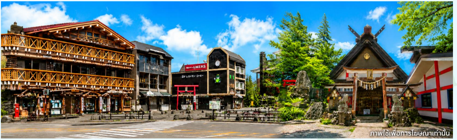
ภาพใช้เพื่อการโฆษณาเท่านั้น

คำ รับประทานอาหารค่ำ ณ ห้องอาหารของโรงแรม อาหารบุฟเฟต์ พิเศษเมนูซาปู (มือที่ 2) 🦀