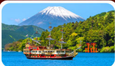
ล่องเรือทะเลสาบอาชิ

28 ส.ค.-02 ก.ย.69 18-23, 23-28 ก.ย.69 04-09, 11-16 ก.ย.69 24-29, 25-30 ก.ย.69 16-21, 17-22 ก.ย.69 30 ก.ย.-05 ต.ค.69