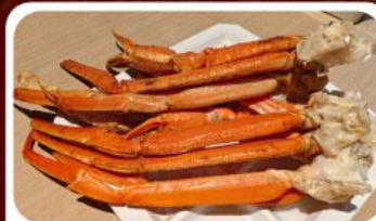
บุฟเฟ่ต์งาปู