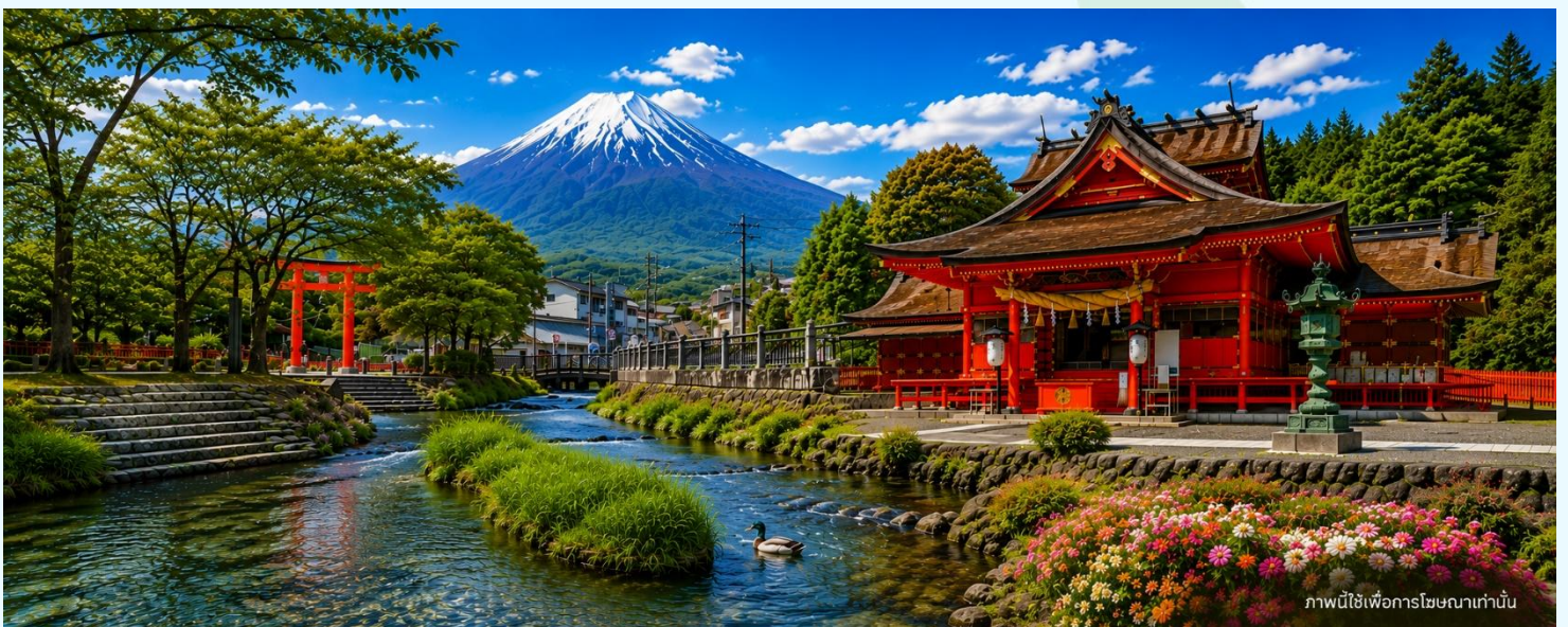
ภาพนี้ใช้เพื่อการโฆษณาเท่านั้น

ศาลเจ้าฟูจิซัง ฮงกุ เซ็นเกิน ไทชะ (Fujisan Hongū Sengen Taisha) ศาลเจ้าศักดิ์สิทธิ์อายุกว่า 1,200 ปี และเป็นศาลเจ้าหลักสำหรับการสักการะ ภูเขาไฟฟูจิ ได้รับการขึ้นทะเบียนเป็น หนึ่งในองค์ประกอบของแหล่งมรดกโลกทางวัฒนธรรม "ภูเขาไฟฟูจิ สถานที่ศักดิ์สิทธิ์และแหล่งบันดาลใจทางศิลปะ" โดยองค์การยูเนสโก เมื่อปี ค.ศ. 2013 เป็นศูนย์รวมศรัทธาที่ชาวญี่ปุ่นนิยมมาขอพรด้าน ความสำเร็จ และการเดินทาง พร้อมชม บ่อน้ำศักดิ์สิทธิ์วาคูตามะอิเกะ (Wakutama-ike) ซึ่งเกิดจากน้ำละลายของหิมะบนภูเขาไฟฟูจิที่ใสสะอาดตลอดทั้งปี