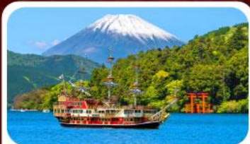
ล่องเรือทะเลสาบอาชิ

เดินทาง 28 ส.ค.-02 ก.ย.69 18-23, 23-28 ก.ย.69 04-09, 11-16 ก.ย.69 24-29, 25-30 ก.ย.69 16-21, 17-22 ก.ย.69 30 ก.ย.-05 ต.ค.69