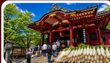
วัดมิตสึดามะโซเด็น