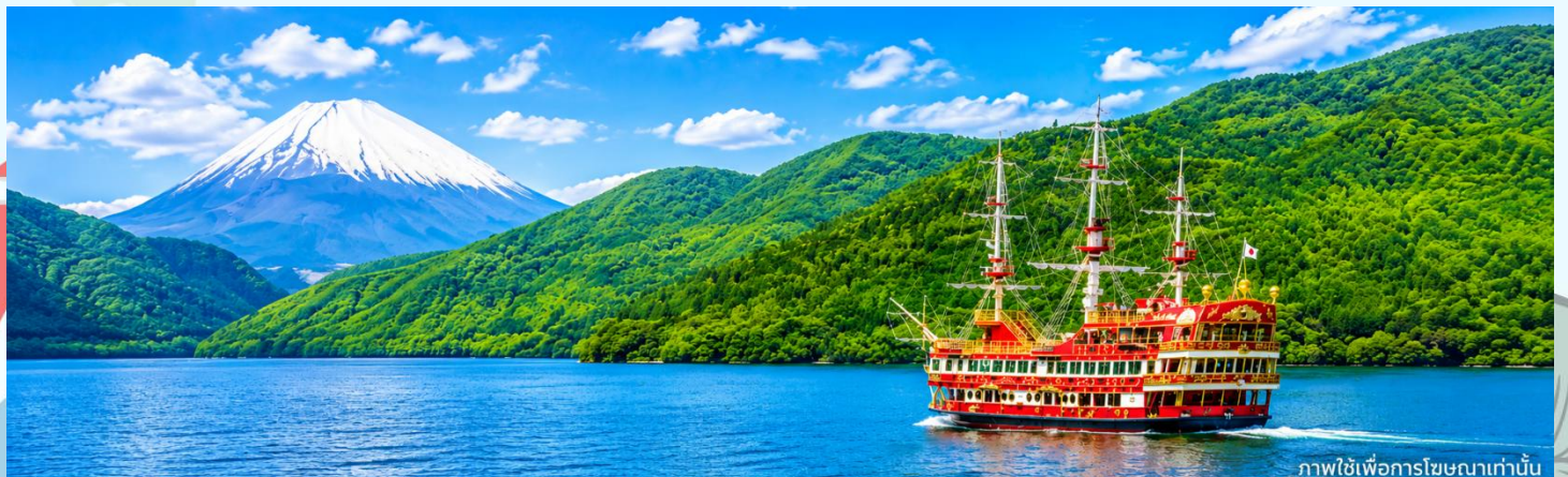
ภาพนี้ใช้เพื่อการโฆษณาเท่านั้น

*** กรณีฝนตกหนัก หรือ เรือไม่เปิดทำการ ขอสงวนสิทธิ์เปลี่ยนเป็นรายการเที่ยว ศาลเจ้าฮาโกเน่ แทน