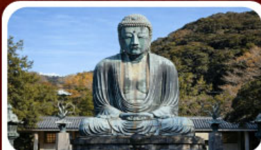
หลวงพ่อดาโอบุตซี