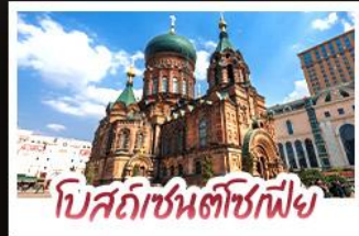
โบสถ์ซันตีซฟีฟ