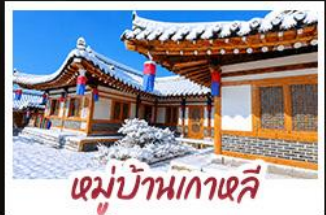
หมู่บ้านเกาเจลี่