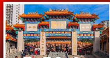
วัดเข้ว้งต้าเซียน