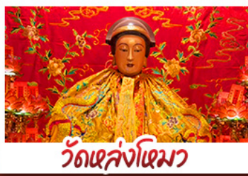
วัดเล่งโง้ว