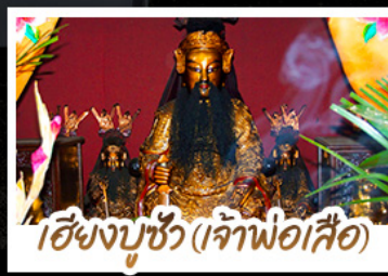
เซียงบูซัว (เจ้าพ่อเสือ)