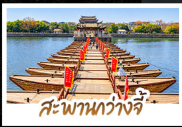
สะพานหว่างจี