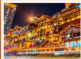
แสงอาคารตั้ง

อุทยานหลุมฟ้าสะพานสวรรค์ • อุทยานเขานางฟ้า • หงหยาดิง • ตึกพูยง ชั้น 22 • วัดต้าอ้อ ชมรถไฟกะลุดัก • สะพานโบราณหนานเฉียว • เมืองโบราณกวนเซียน • อุทยานภูเขาสีดรุณี อุทยานต้ากู่ปิงชาน • จตุรัสหยางเทียนหวู่ • รูปปั้นหมีแพนด้าอนเซลฟี • ร้านหมิงซือจงซูเก๋ ถนนคนเดินซุนซีลู่ • หมีแพนด้าปิ่นตึก IFS • ถนนไม้ไถ่กู๋หลี่ • ถนนโบราณชอยกว้างชอยแคบ