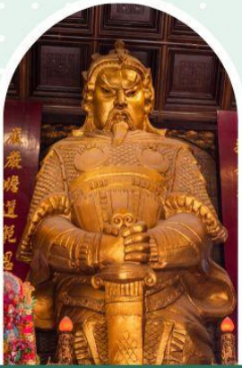
วัดเซกวง

"ไหว้พระ เสริมดวง เพิ่มสิริมงคลแก่ชีวิต"