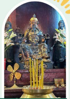
วัดปุกโตฮองฮำ