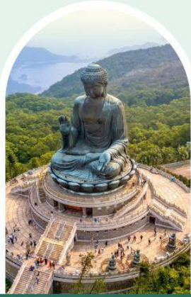
พระใหญ่โป่วหลิน