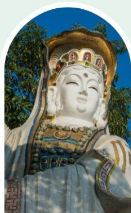
เจ้าแม่กวนอิม ธิพลสัย