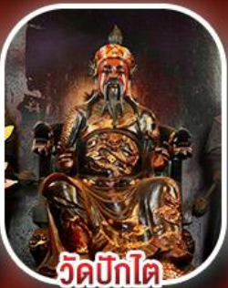
วัดปึกไต่