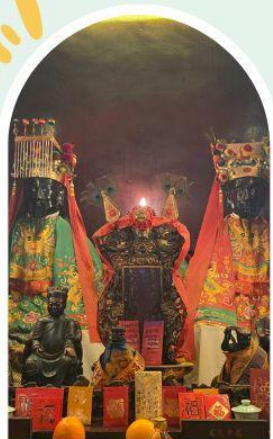
วัดหมิ่นโหมว