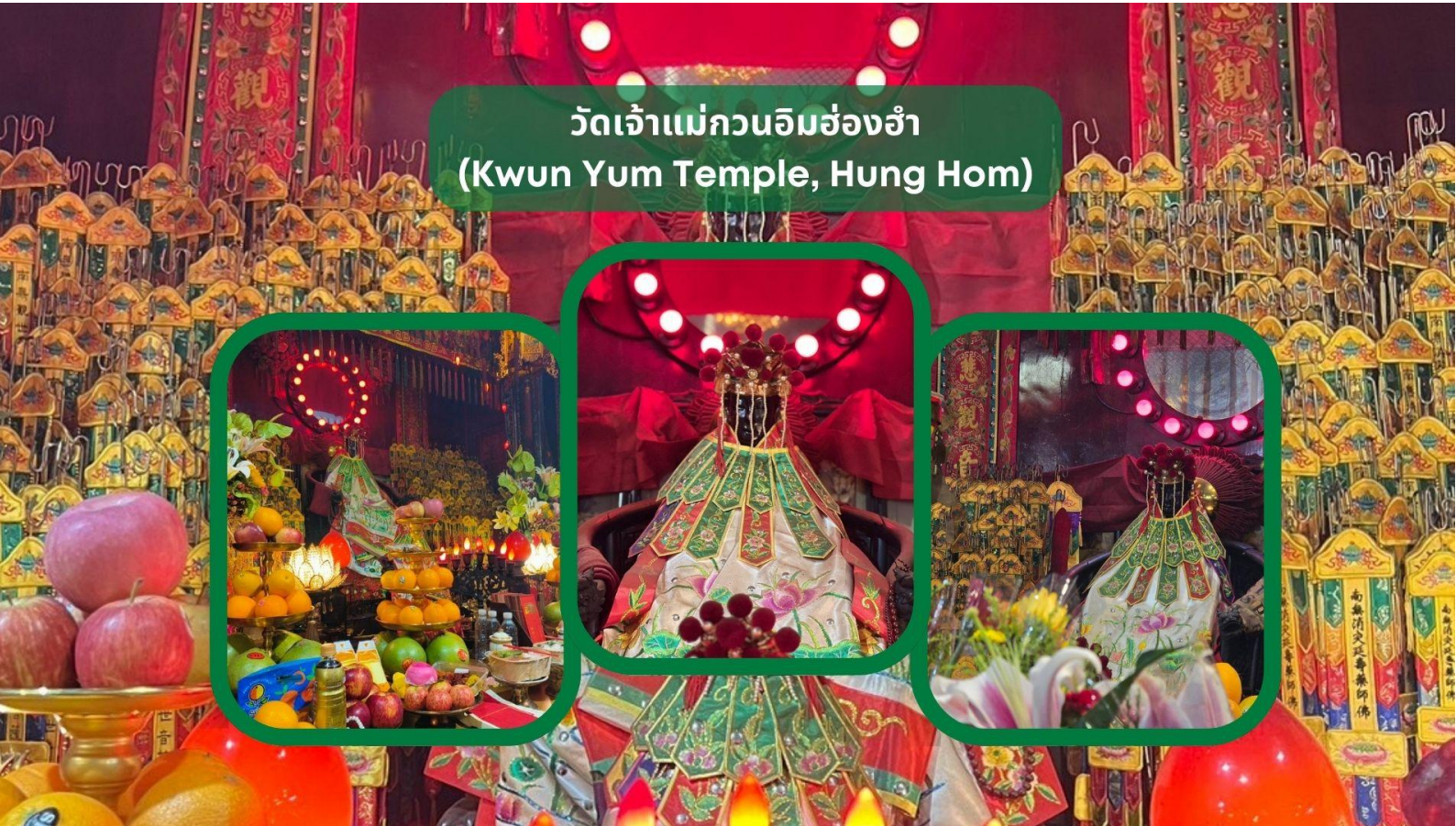
วัดเจ้าแม่กวนอิมฮ่องกง (Kwun Yum Temple, Hung Hom)

เช้า รับประทานอาหารเช้า ณ ภัตตาคาร บริการท่านด้วยเมนูติ่มซำฮ่องกง (มื้อที่ 3)