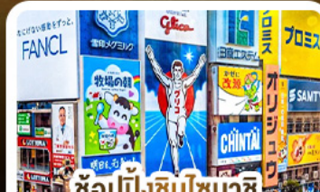
ซ้อปั้งชินโซบาชิ และโดตงโมริ