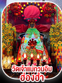
วัดเจ้แม่กวนอิม ชองฮ้า