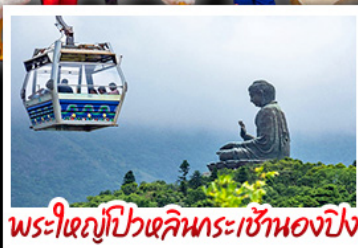
พระใหญ่ไผ่หลินและกระเช้าเองปีง