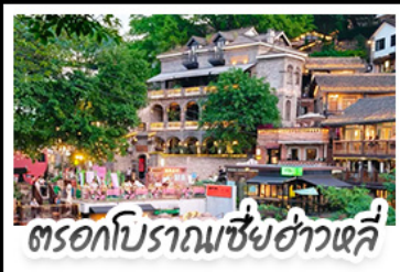
ตรอกโบราณเซี่ยฮ่าวหลี่