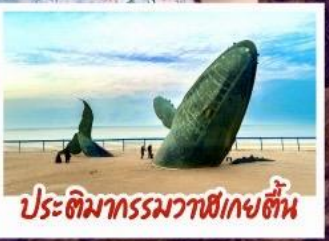
ประติมากรรมวาฬยกขึ้น