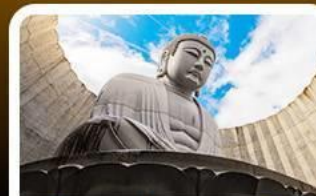
เป็นเขาแห่งพระพุทธรเจ้า