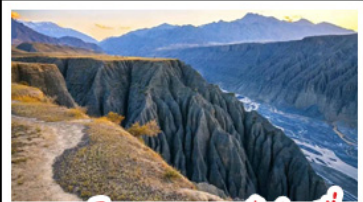
แกรนด์แคนยอนตุ่ซ่านจื่อ

ทะเลสาบโซหลี่มู่ - คานาสี แกรนด์แคนยอนตุ่ซ่านจื่อ ตลาดแกรนด์บาซาร์ - หมู่บ้านเหม่อมู่