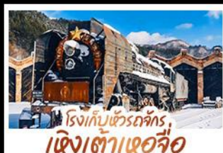
โรงเก็บข้าวรถจักร, เจิงเต่าเอ้อจื่อ