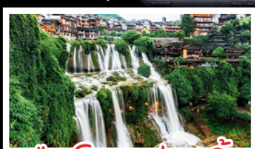
เมืองโบราณผู่แรงเงิน