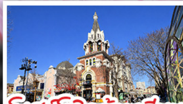
โบสถ์โกธิคต้าเหลียน