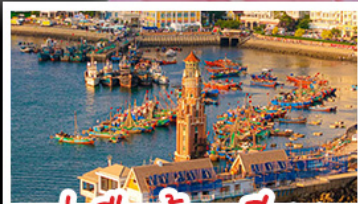
ท่าเรือต้าเหลียน