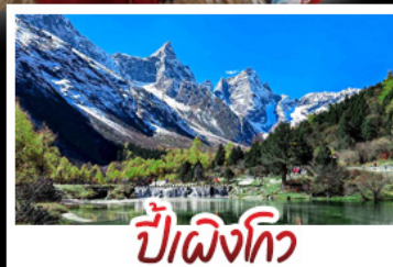
ป่าผึ้งโกว