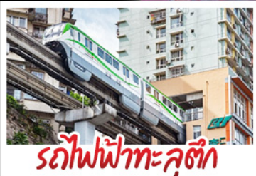
รถไฟฟ้าทะเลสาบ