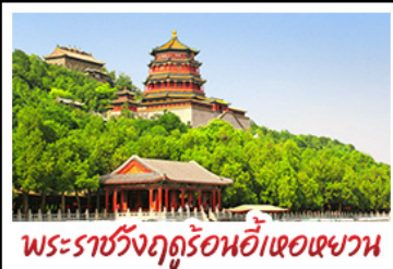
พระราชวังฤดูร้อนอู่เหอหยวน

กำแพงเมืองจีนด่านจวิรงกวน - พระราชวังฤดูร้อนอู่เหอหยวน สวนจิงอัน - วัดลามะ - ไม่หลงร้านช้อปปิ้ง - โรงแรม 4 ดาว มือพิเศษ เปิดปิกนิก สุกี่มองโกล MICHELIN GUIDE ร้าน TAO TAO JU