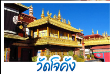
วัดโจคัง