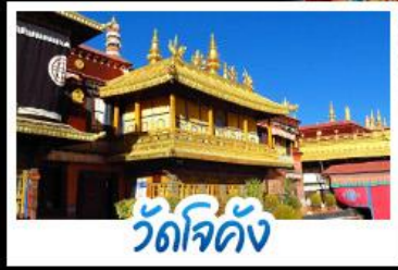
วัดโจคัง