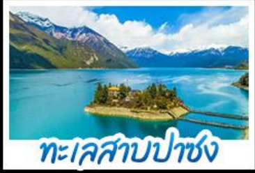
ทะเลสาบปาซง

รถไฟสายหลังคาโลก พระราชวังโปตาลา วัดโจคัง - ทะเลสาบปาซง พระราชวังฤดูร้อนเนอร์บูลิงคา