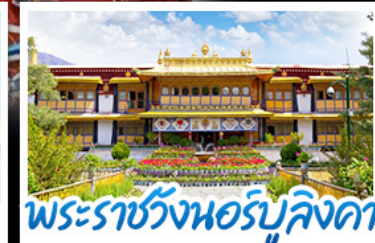
พระราชวังฤดูร้อนแอร์บุคิงดา