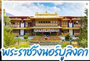
พระราชวังเนอร์บูลิงคา