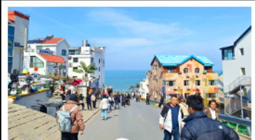
ถนนคาเพลิ่งหมายเลข 8